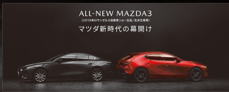
ALL-NEW MAZDA3 (2018年ロサンゼルス自動車ショー出品/北米仕様車) マツダ新時代の幕開け